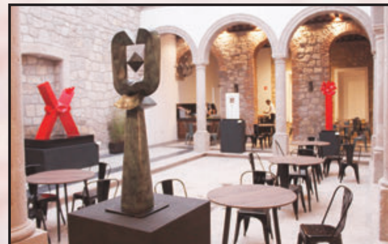
Los amantes de la cultura pueden admirar la obra de varios artistas.