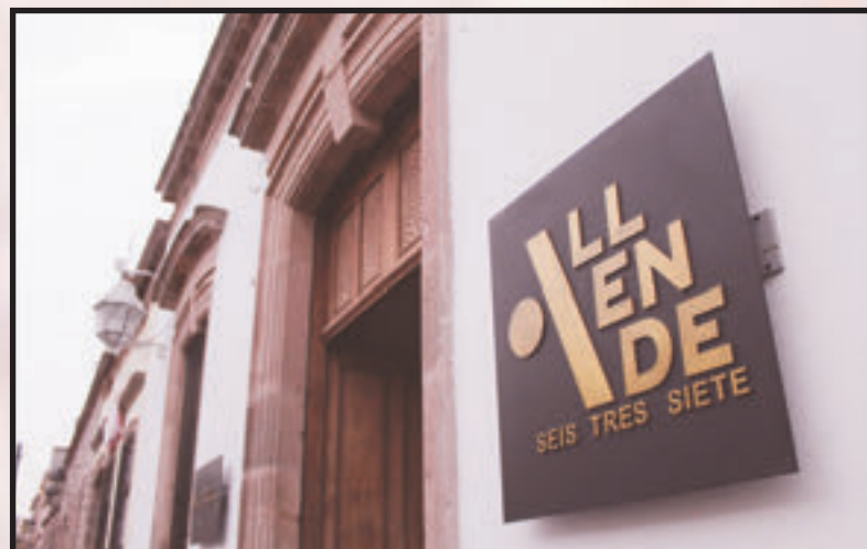
Se estrena el espacio para la expresión artística en el corazón de Morelia.