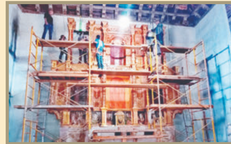
Con esmero, fue recuperado el retablo con base a un estudio académico.