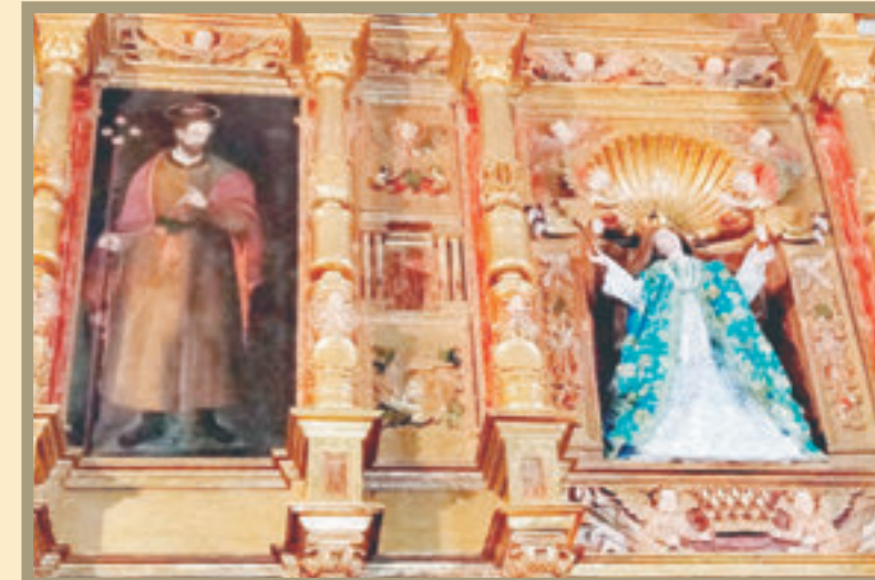
Se devolvió el dorado del retablo que da realce a las imágenes religiosas.

tauración fue la eliminación de esa pintura blanca que ocultaba muchos de los tesoros del retablo. La policromía debajo descubrió que la gran mayoría de la estructura era de color dorado y tenía acabados en hoja de oro. En la Predela se encontraron los cuatro doctores que son el soporte y la base a partir de los cuales se construye la iglesia católica: San Jerónimo, San Ambrosio, San Gregorio Magno y San Agustín.