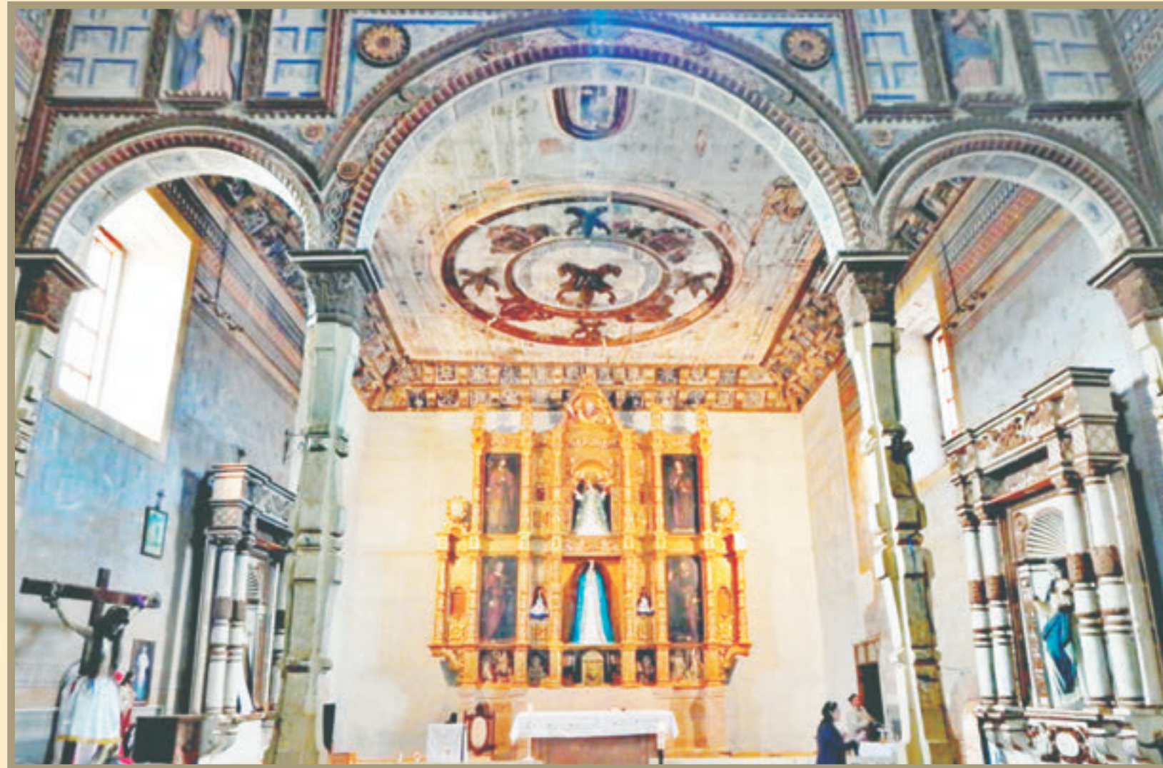
Gracias a la suma de esfuerzos de las dependencias y de la población, fue restaurado el retablo en oro del templo de Nuestra Señora de la Asunción.

“Nosotros fuimos y le dijimos a la comunidad tienen una pieza histórica, una maravilla de retablo del siglo XVI y la comunidad, hemos estado tanto tiempo ahí, que se han apropiado de esto, hicieron un patronato y se pusieron las pilas”, comparte la directora de la Sección de