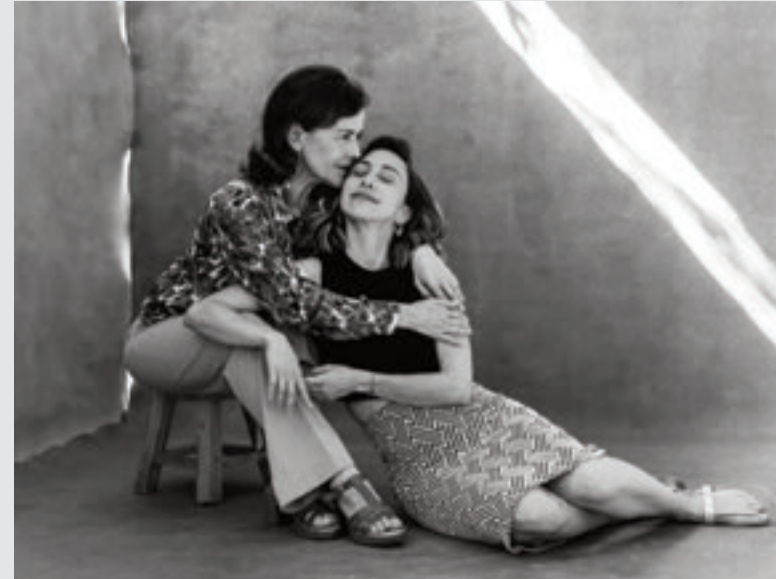
FAMILIA DEL TORO