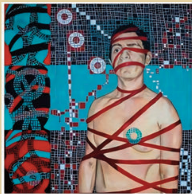
LIMPIEZA PROFUNDA, TÉCNICA ACRÍLICO