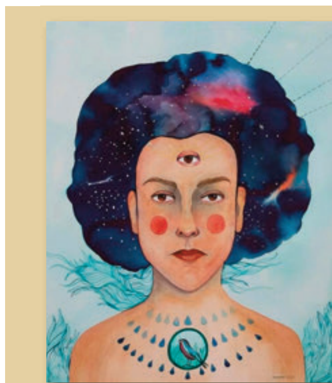
POLVO DE ESTRELLA, TÉCNICA ACUARELA

La formación continua es parte esencial de "La Casita", por lo que semestre a semestre se promueve que las personas dedicadas a la coordinación y aquellas que facilitan los talleres continúen su proceso de aprendizaje en temas de cultura comunitaria, pedagogías, coordinación de espacios cultu-