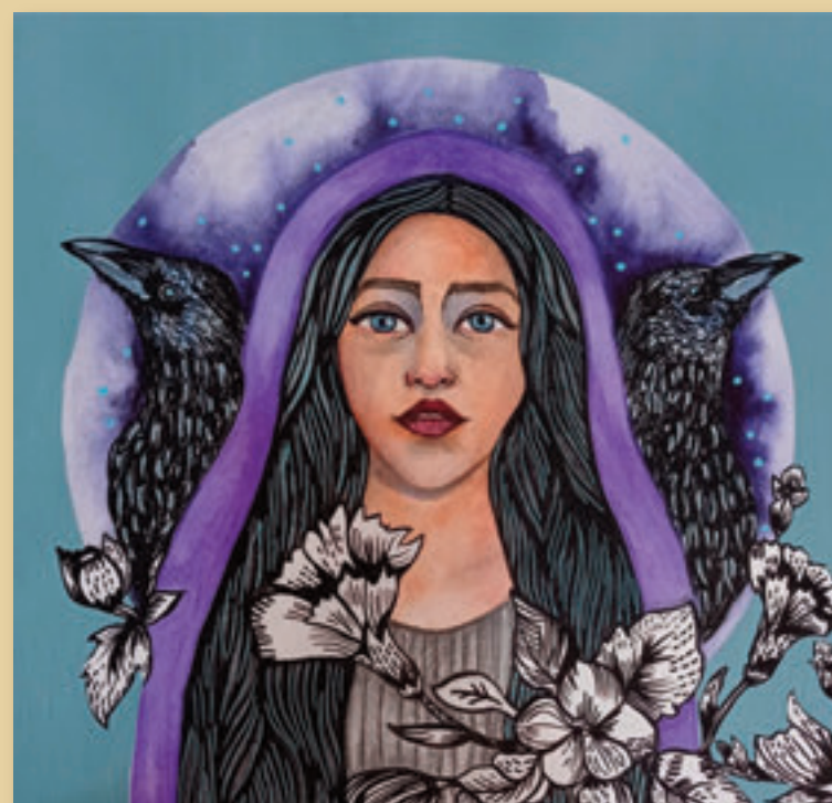
LA BRUJA, TÉCNICA ACUARELA Y ACRÍLICO