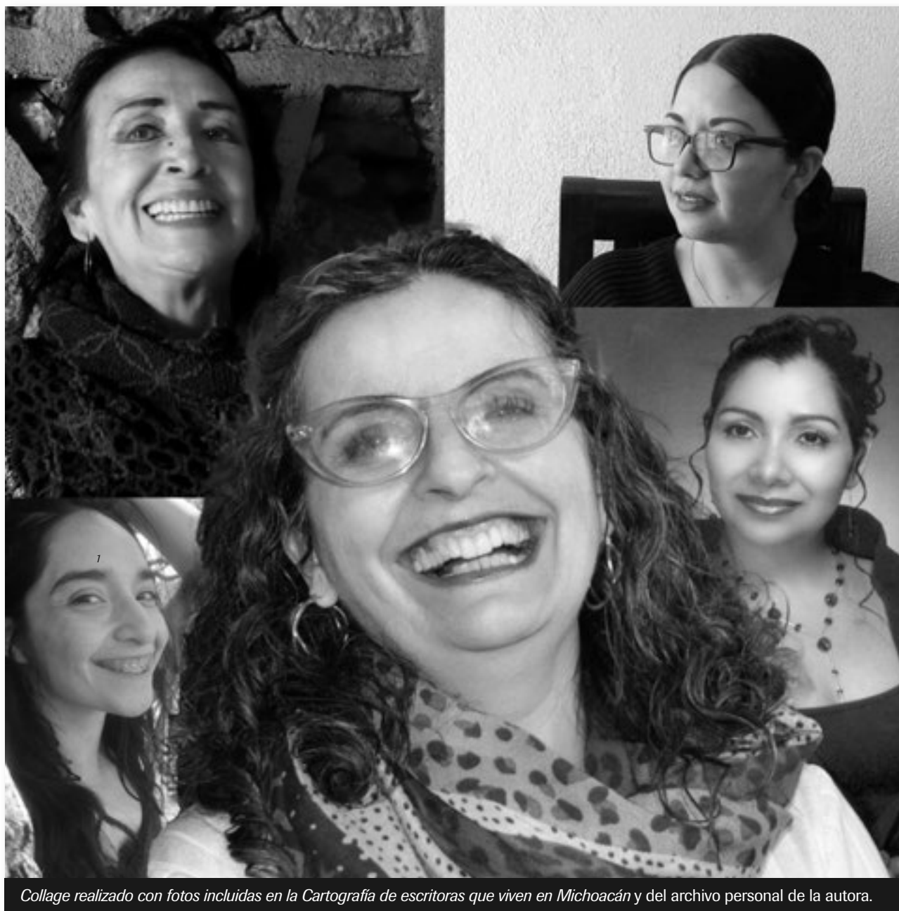
Collage realizado con fotos incluidas en la Cartografía de escritoras que viven en Michoacán y del archivo personal de la autora.