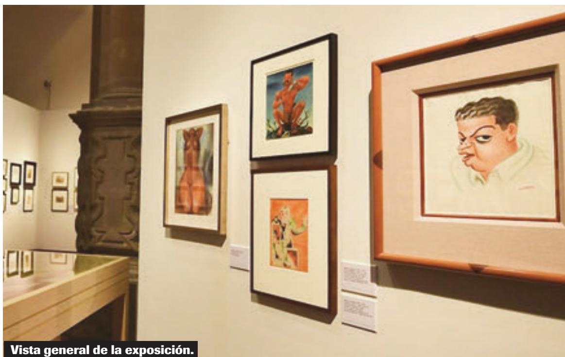
Vista general de la exposición.