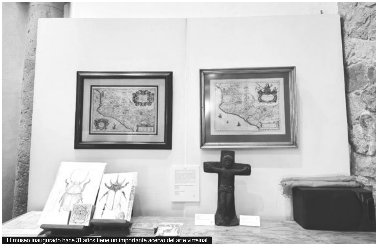
El museo inaugurado hace 31 años tiene un importante acervo del arte virreinal.

En el mapa se logran observar múltiples sitios marcados con puntos o con edificaciones en los que se muestran sus topónimos; diversas elevaciones montañosas son apreciadas, así como lagos y ríos. La edición está a colores, el territorio representado está decorado en el litoral costero del Pacífico de tono amarillo (dato importante ya que, en otras ediciones, se divide en tres partes el territorio: Nueva Galicia, Nueva España y el norte, donde persistía la presencia de los grupos chichimecas).