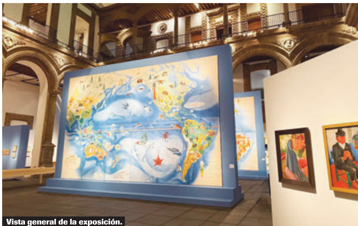
Vista general de la exposición.