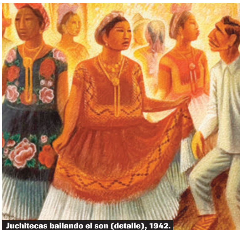
Juchitecas bailando el son (detalle), 1942.