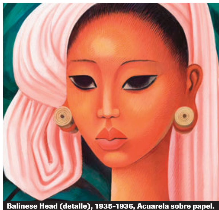
Balinese Head (detalle), 1935-1936, Acuarela sobre papel.