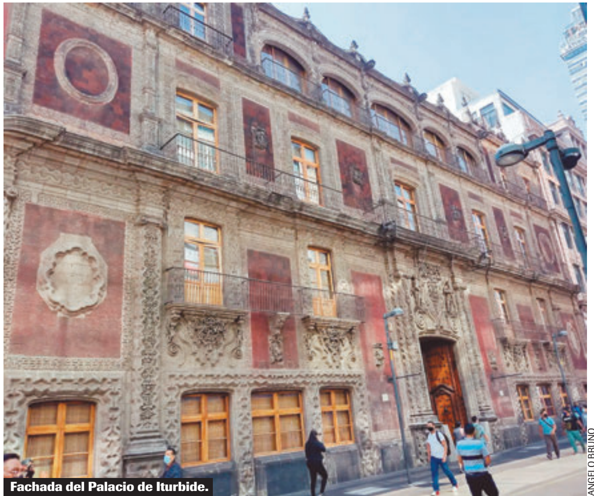
Fachada del Palacio de Iturbide.

Nació en 1904 en una Ciudad de México, en un periodo de momentos convulsos para la nación, pero también en los territorios de gestación del nacionalismo mexicano en el arte. Desde joven, prefirió los lápices a los libros: abandonó la Escuela Nacional Preparatoria para dibujar caricaturas en la Secretaría de Educación Pública, rodeado de muralistas e intelectuales que veían en su trazo ágil una chispa singular. A los 19 años, quien también era apodado "El Chamaco", se mudó a Nueva