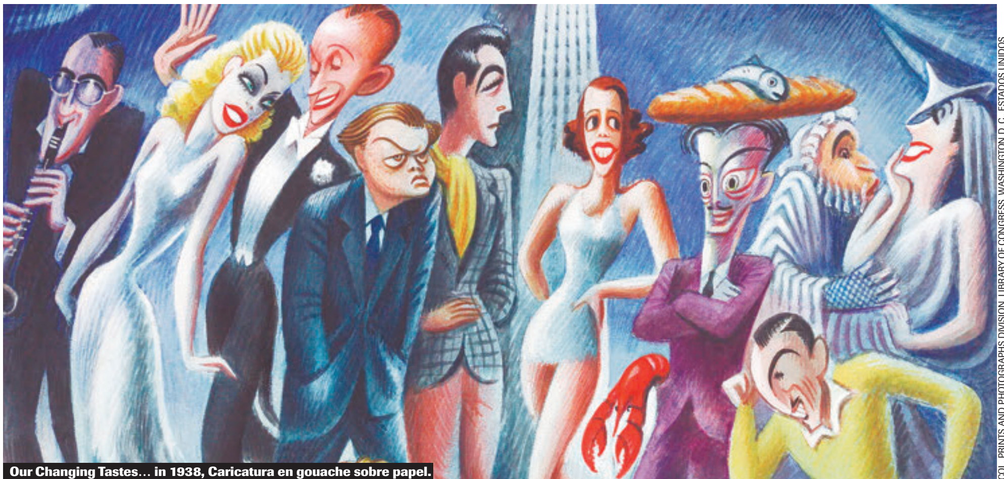
Our Changing Tastes... in 1938, Caricatura en gouache sobre papel.