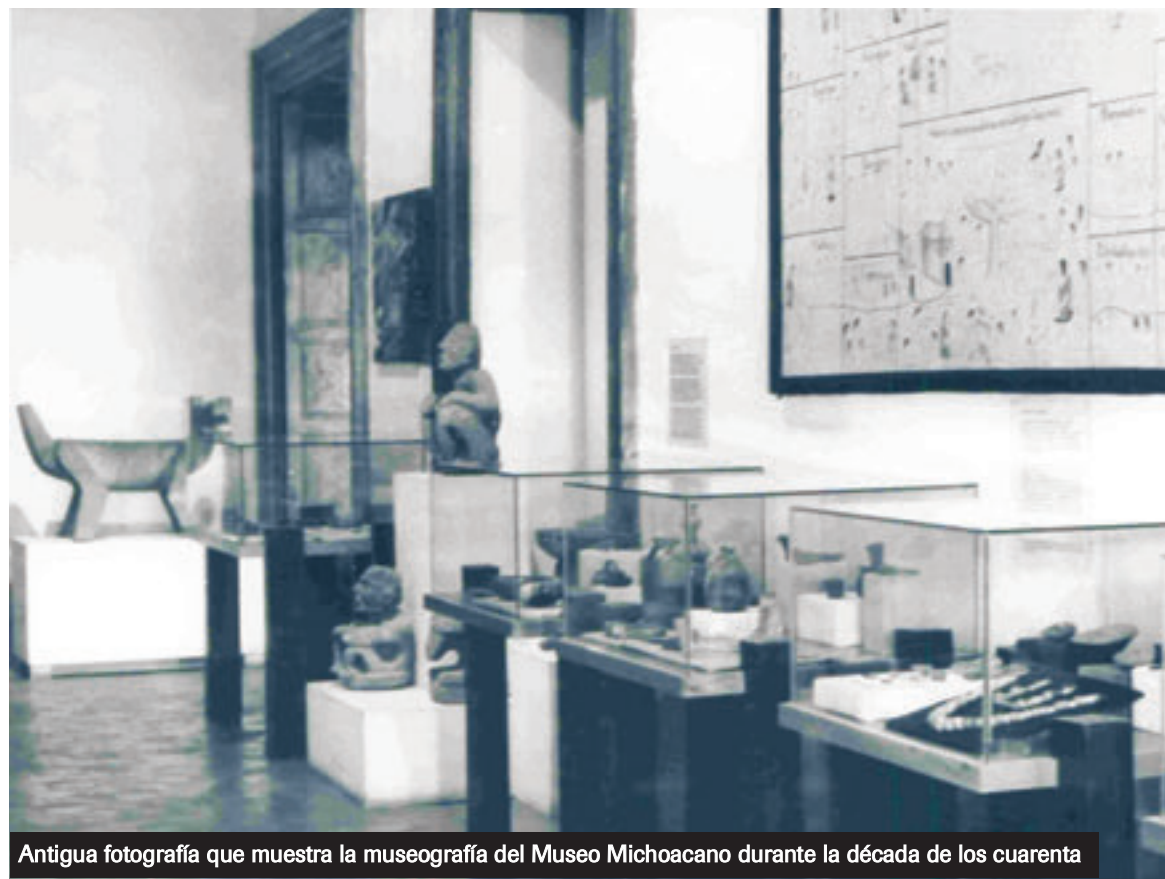
Antigua fotografía que muestra la museografía del Museo Michoacano durante la década de los cuarenta

En el ámbito colonial, una de las joyas más sobresalientes fue una pintura del siglo XVIII que retrata al noble indígena Don Antonio Huitzimengari,