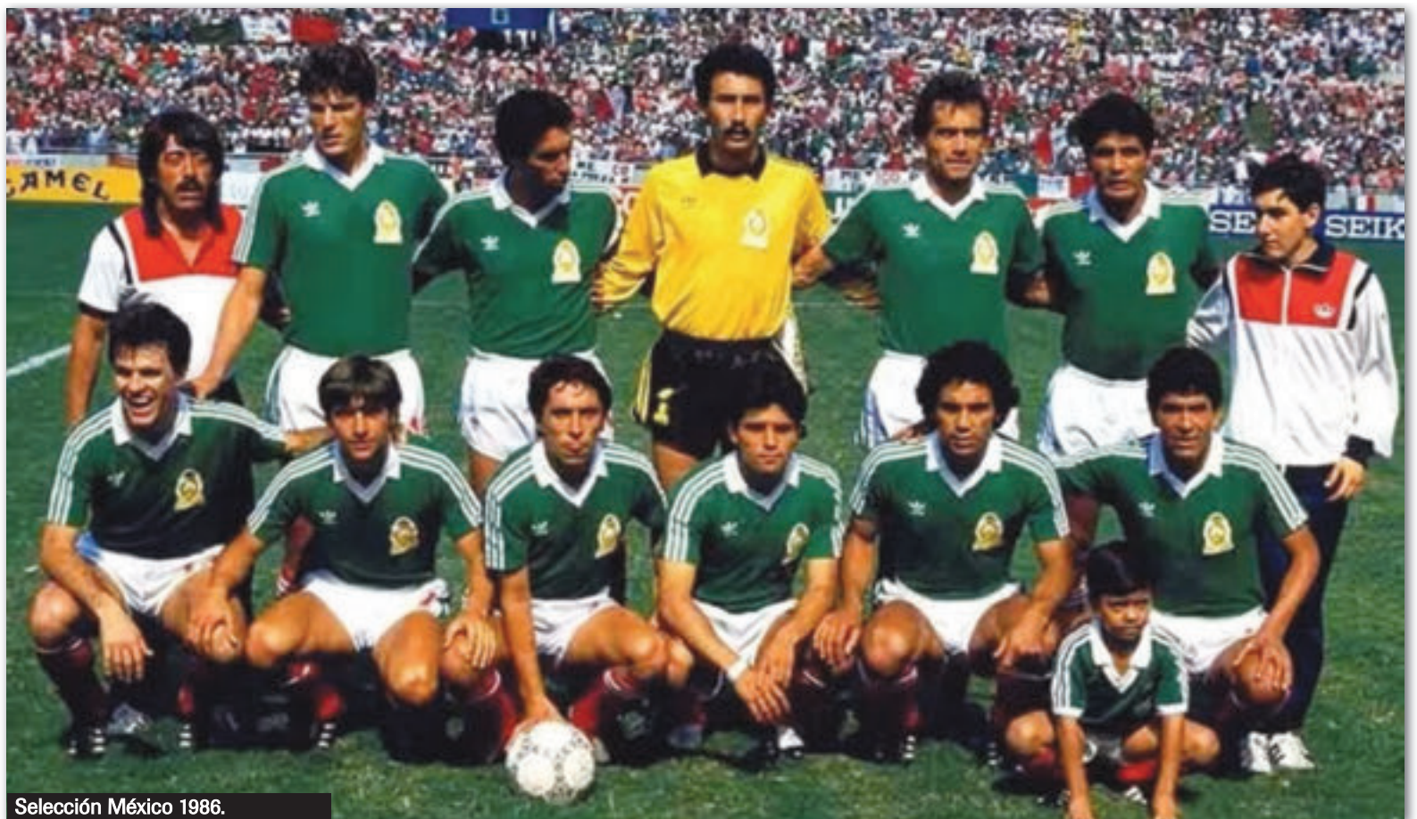
Selección México 1986.