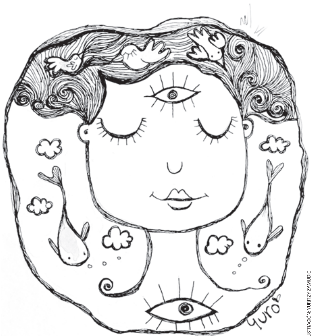
ILUSTRACIÓN: YURITZY ZAMUDIO

Me adentro en el desierto. Avanzo por donde se abre la tierra, guiada por la intuición. No hay un solo camino. La ruta – aunque incierta – es la indicada. Bordeo huizaches, rocas gigantes, arroyos que se ensanchan. De pronto, una poza de agua La reconozco: origen y destino. Ombligo de la tierra. Al asomarme, veo constelaciones de piedras brillantes que cuentan historias sobre mí. En el cielo vuelan peces. En el fondo del agua, las parvadas son cardúmenes que nadan libres, en una danza de plumas, escamas y nubes. Tomo el agua con las manos. Bebo. Cierro los ojos. Siento en la boca el alivio de haber llegado al lugar que siempre busqué.